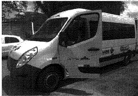
Prefeitura de São Luís entrega veículo novo e adaptado para transporte de pacientes da Apae

A gestão do prefeito Edivaldo Holanda Junior realizou, na manhã desta quinta-feira (7), a entrega de um veículo novo e adaptado para a Associação de Pais e Amigos dos Excepcionais (Apae) São Luís, entidade assistencial e educacional sem fins lucrativos que promove a atenção integral à pessoa com deficiência. O meio de transporte é fruto de termo de cessão firmado a Prefeitura de São Luís por meio da Secretaria Municipal de Saúde (Semus) e o Ministério da Saúde. O veículo contém, além dos itens básicos, elevador próprio para acesso de pessoas com limitações físicas e assentos preparados para o transporte. Além disso, o carro é equipado com tacógrafo, que registra o itinerário do veículo e restringe a velocidade do mesmo, contribuindo para a segurança dos usuários.